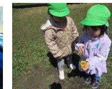
理事長先生と記念撮影