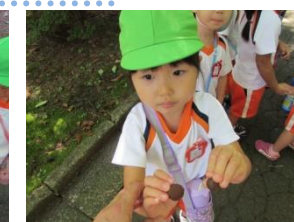
せみのめけがらたくさんみつけたね