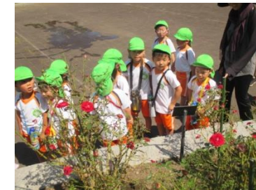
ぼらのほなきれいだね